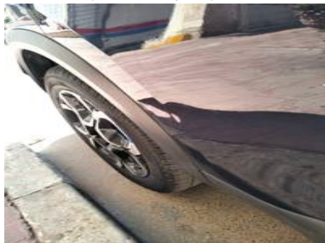
Porte arrière droite (Défaut aspect)